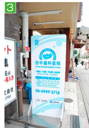
3 医院はビルの3階です。