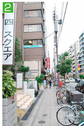
2 階段を上って、東に進むと、すぐ看板が見えてきます。