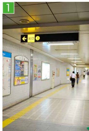
1 地下鉄の改札を出て、3番出口へ